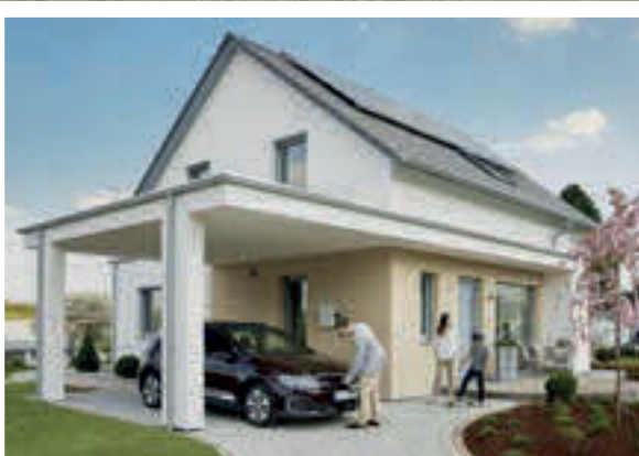
Die Zukunft, schon Gegenwart: Im Carport wird das Elektroauto mit Strom betankt.