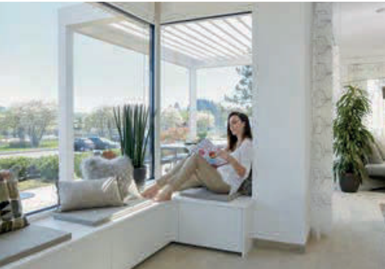
Liebblingsplatz: Eine „Fenster-Bank“ sorgt für gute Aussichten, im Hintergrund die Pergola.